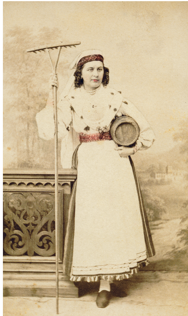
Lydia Koidula. 1867. Esimene foto, mille Lydia Koidula saatis Friedrich Reinhold Kreutzwaldile. Lydia Koidula. 1867. The first photograph that Lydia Koidula sent to Friedrich Reinhold Kreutzwald.

Teie armas, armas päevapilt! Jah, see on seesama unustamata kallid silmanägu, mida mullu sui ühe tuttava juures pisut väiksemas kujus nägin, mis jala tunniks ajaks enda ette seisatas, et kadedus võõra pildi- peremehe peale rinnus põlema süttis. Teie ei või eales teada, kui suurt rõõmuehmatust mulle selle lootmata läkitamisega valmistasite! (L. Koi- dula Fr. R. Kreutzwaldile, Tartus 29.03.1868). Your lovely, lovely picture! Yes, this is the same unforgettable dear face that I saw last summer at a friend's place in a smaller format. It halted my feet for an hour as envy towards the owner of the picture flamed in my chest. You can never know what immense joy you brought to me with this unexpected gift! (L. Koidula to Fr. R. Kreutzwald, Tartu 29.03.1868)