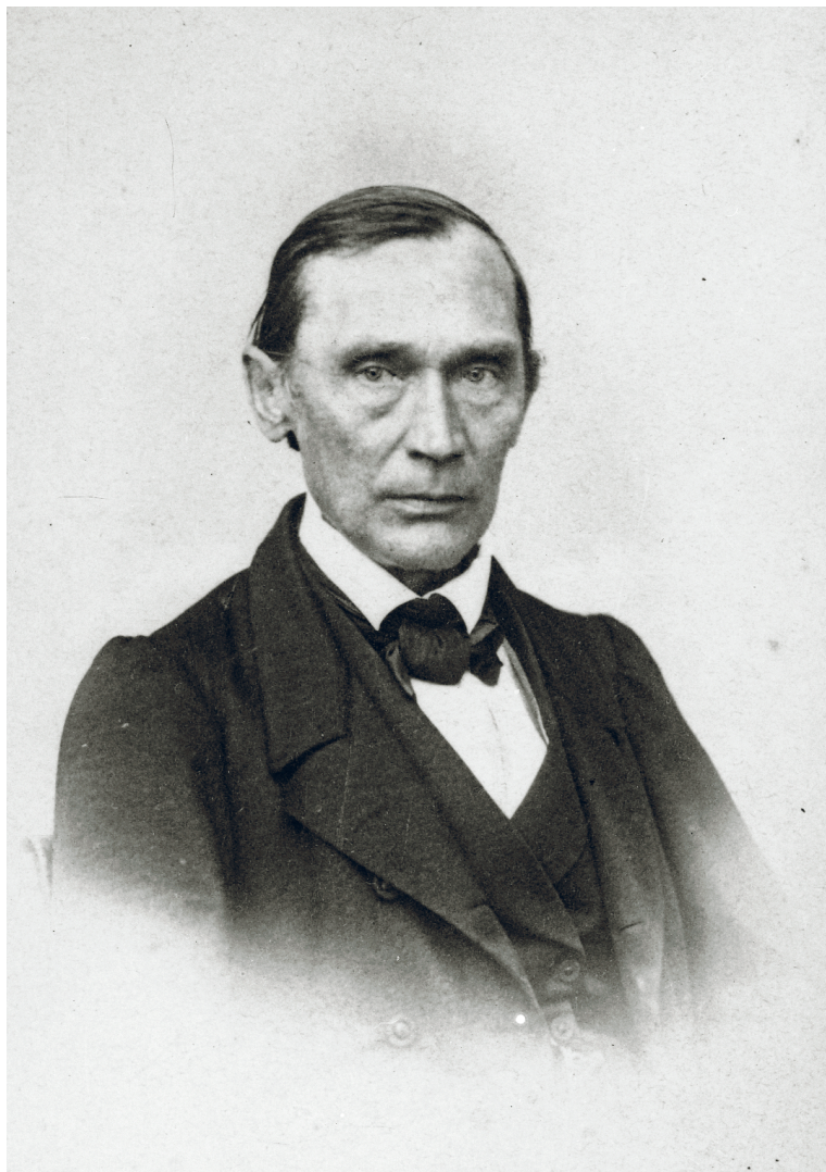
Friedrich Reinhold Kreutzwald. 1860ndate lõpp. Friedrich Reinhold Kreutzwald. End of 1860s.