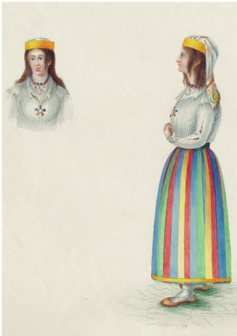
Eesti talunaine iseloomuliku peakattega ja kirjus seelikus. Fr. R. Kreutzwaldi käsikirjast „Virumaa rahvarõivastest“. Tabel II. 1842. Eesti Rahva Muuseum.

An Estonian peasant woman with typical headgear and coloured skirt. From Fr. R. Kreutzwald's manuscript National Costumes of Viru County . Table II. 1842. Estonian National Museum.