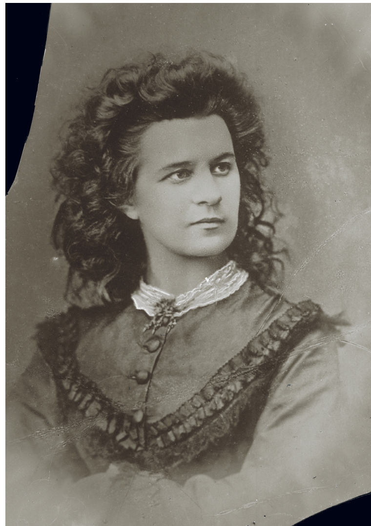
Lydia Koidula. 1869. Teine foto, mille Lydia Koidula saatis Kreutzwaldile: nn „tsiviliseeritud“ pilt. Lydia Koidula. 1869. Another photo sent by Lydia Koidula to Kreutzwald, the so-called 'civilised' picture.

Seda nägu, armas isa, mis siin Teie kätte tuleb, ei kanna ma täna enam mitte, oh ei! (L. Koidula Fr. R. Kreutzwaldile. Tartus 17.10.1869). The face, dear father, that you are seeing here, I am no longer wearing today, oh no! (L. Koidula to Fr. R. Kreutzwald. Tartu 17.10.1869).