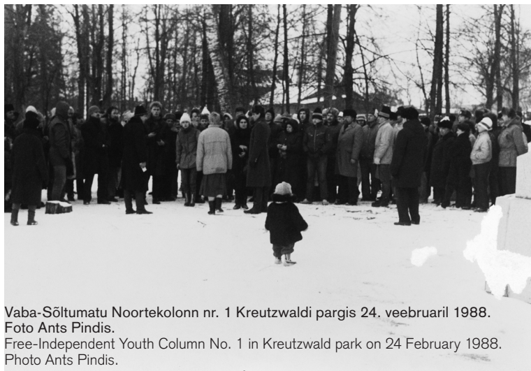
Vaba-Sõltumatu Noortekolonn nr. 1 Kreutzwaldi pargis 24. veebruaril 1988. Foto Ants Pindis. Free-Independent Youth Column No. 1 in Kreutzwald park on 24 February 1988. Photo Ants Pindis.

Paremal: Vaba-Sõltumatu Noortekolonn nr. 1 küüditamisohvrite mälestamis- miitingul samas 25. märtsil 1988. aastal. Foto Ants Pindis. On the right: Free-Independent Youth Column No. 1 at the Commemoration of those deported to the Gulag in Kreutzwald park on 25 March 1988. Photo Ants Pindis.